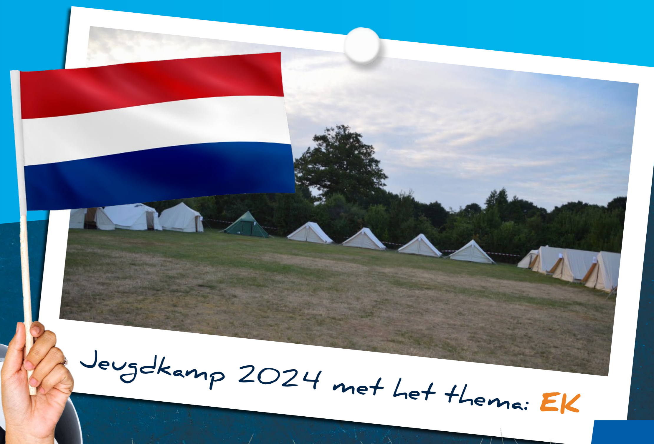
Jeugdkamp 2024 met het thema: EK

We hebben al meer dan 70 aanmeldingen ontvangen voor het kamp! Dat maakt ons erg blij. Om alles goed te laten verlopen, hebben we vrijwilligers nodig. Gelukkig hebben zich al veel vrijwilligers gemeld. De organisatie van het jeugdkamp zal dit verder bekijken. Als blijkt dat we voor bepaalde taken nog vrijwilligers nodig hebben, zullen we tijdig een oproep plaatsen. Extra vrijwilligers om het hele kampweekend te begeleiden zijn in ieder geval gewenst! Ouders en oudere (jeugd)leden zijn welkom om te helpen. Aanmelden kan via jeugdkamp@vvg25.nl